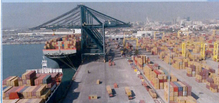
Grand port maritime de Marseille

Το έργο ξεκίνησε τον Ιούνιο του 2010 και αναμένεται να ολοκληρωθεί το Νοέμβριο του 2012.