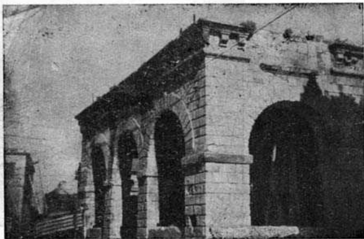
Εἰκ. 29. Ἔργασίαι ἀναστηλώσεως Ἐνετ.Λέσχης Ρεθύμνης.