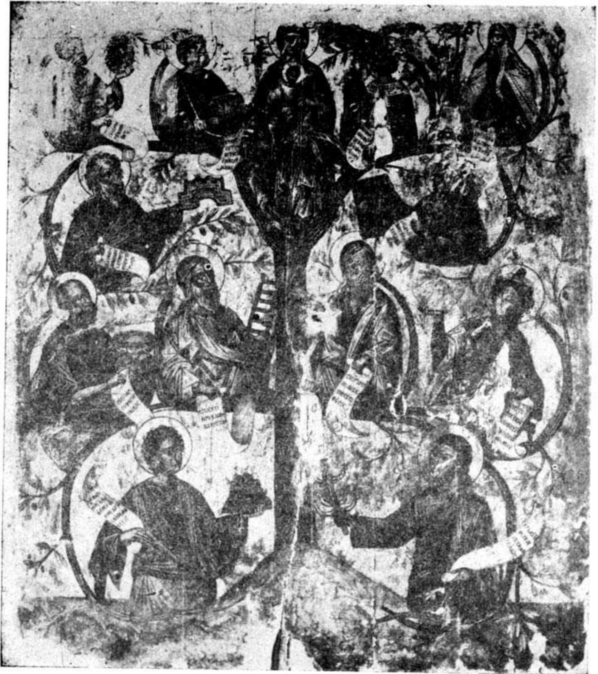
Ἡ εἰκὼν «Ἄνωθεν οἱ Προφῆται» τῆς Ἱερᾶς Μονῆς Γκουβερνιώτισσας παρὰ τὸ χωρίον Ποταμιᾶς Πεδιάδος.