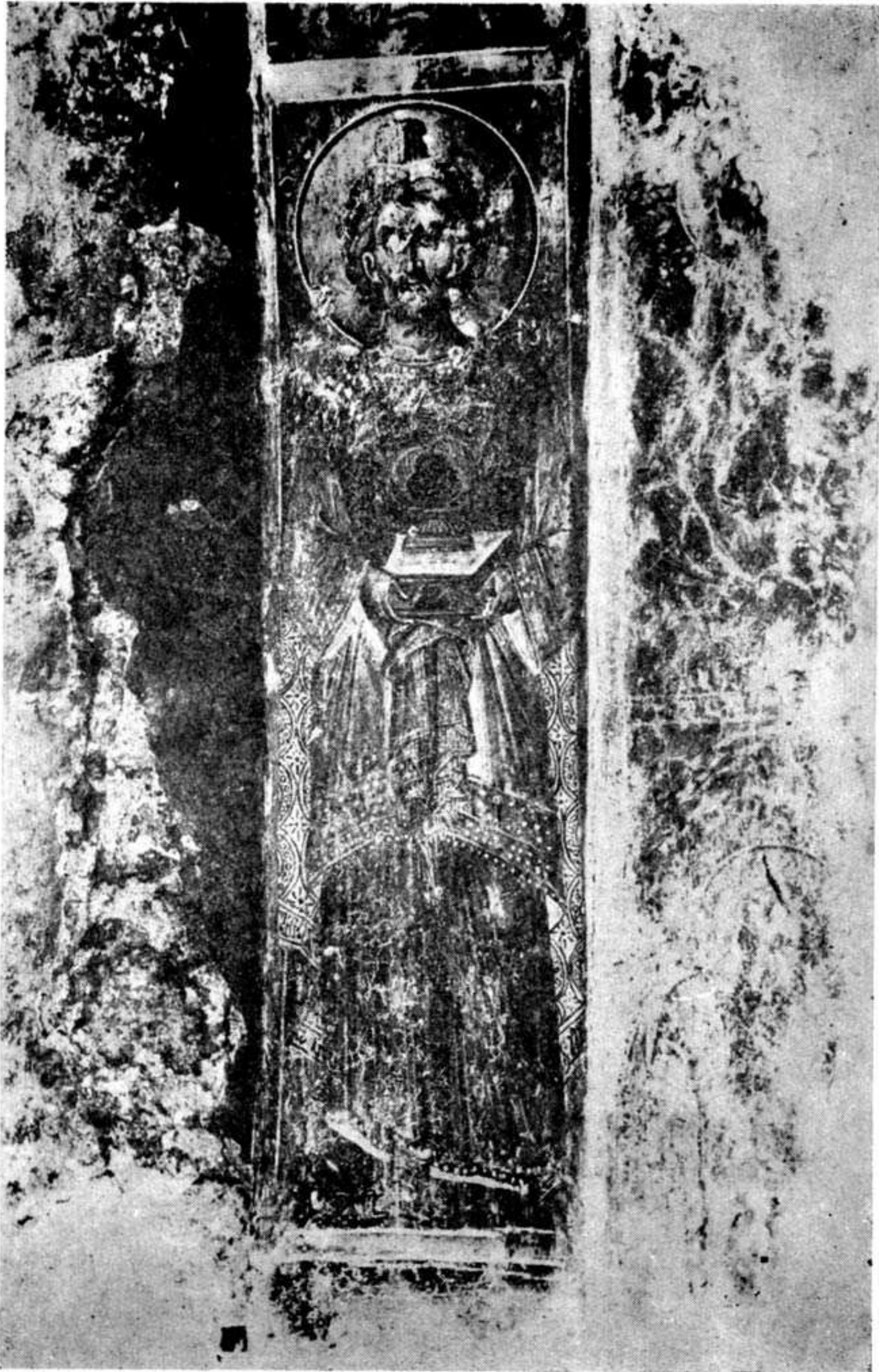
Ὁ Προφήτης Μωϋσῆς, τοιχογραφία τοῦ Ἁγίου Χριστοῦ παρὰ τὸ χ. Ποταμιές.