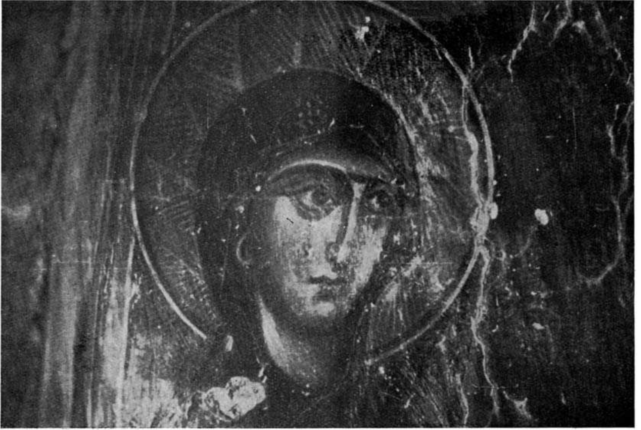
Εἰκ. 1 (ἄνω).—La Sainte Vierge. Fresque de l'église S Jean «στο Σπή- λιο» du village Kalogerou de l'île de Crète.—XIV siècle.