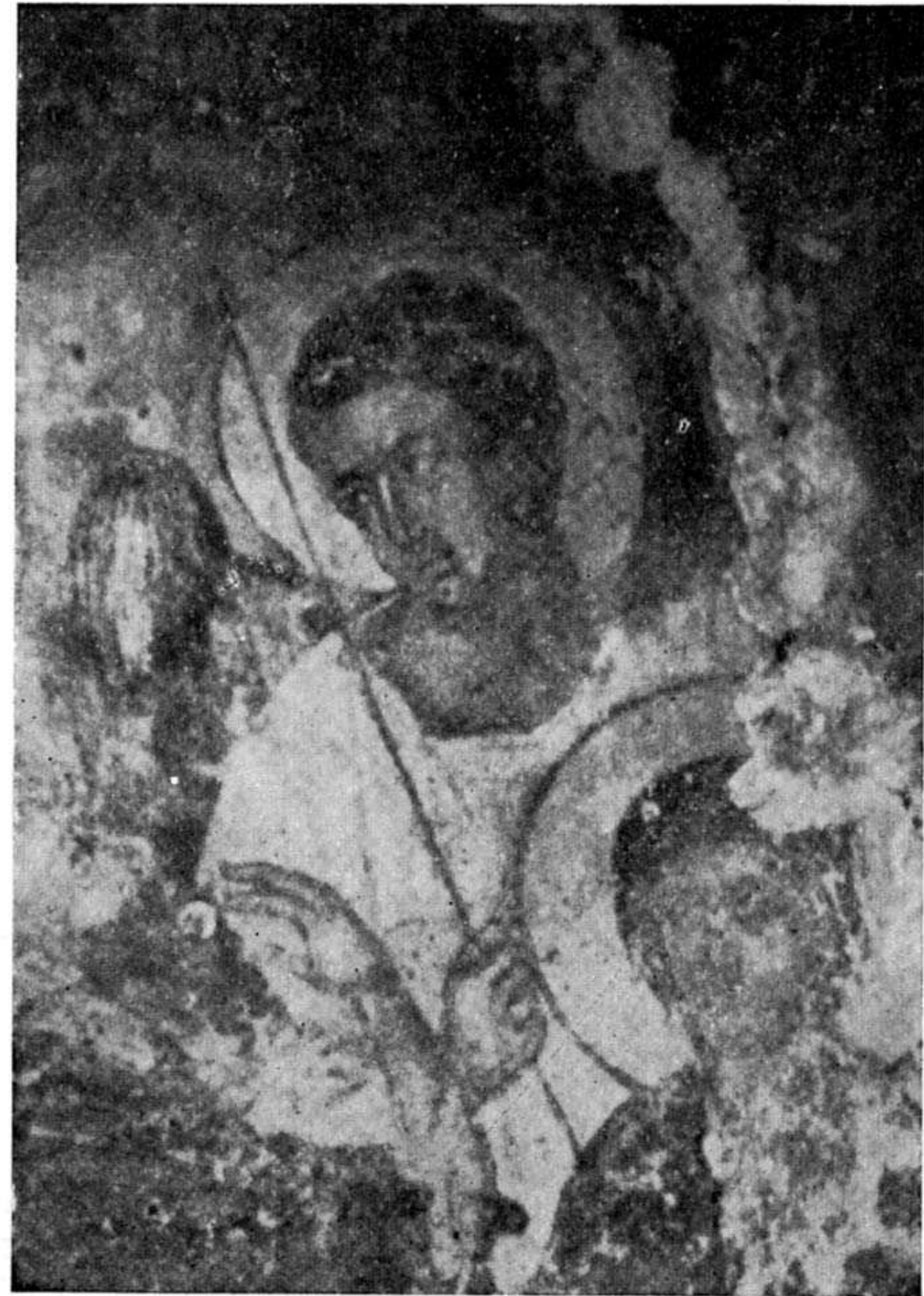
Εἰκ. 2.—Un de deux anges de l'«Ascension». Église de S. Vierge, Hagia Paraskevi, Amari.—XVI siècle.