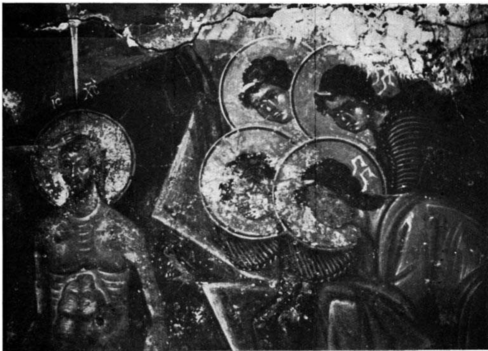
Εικ. 1. — Baptême du Christ. Fresque à l' église de la S. Vierge du village Lambiotes. — Fin du XV siècle.