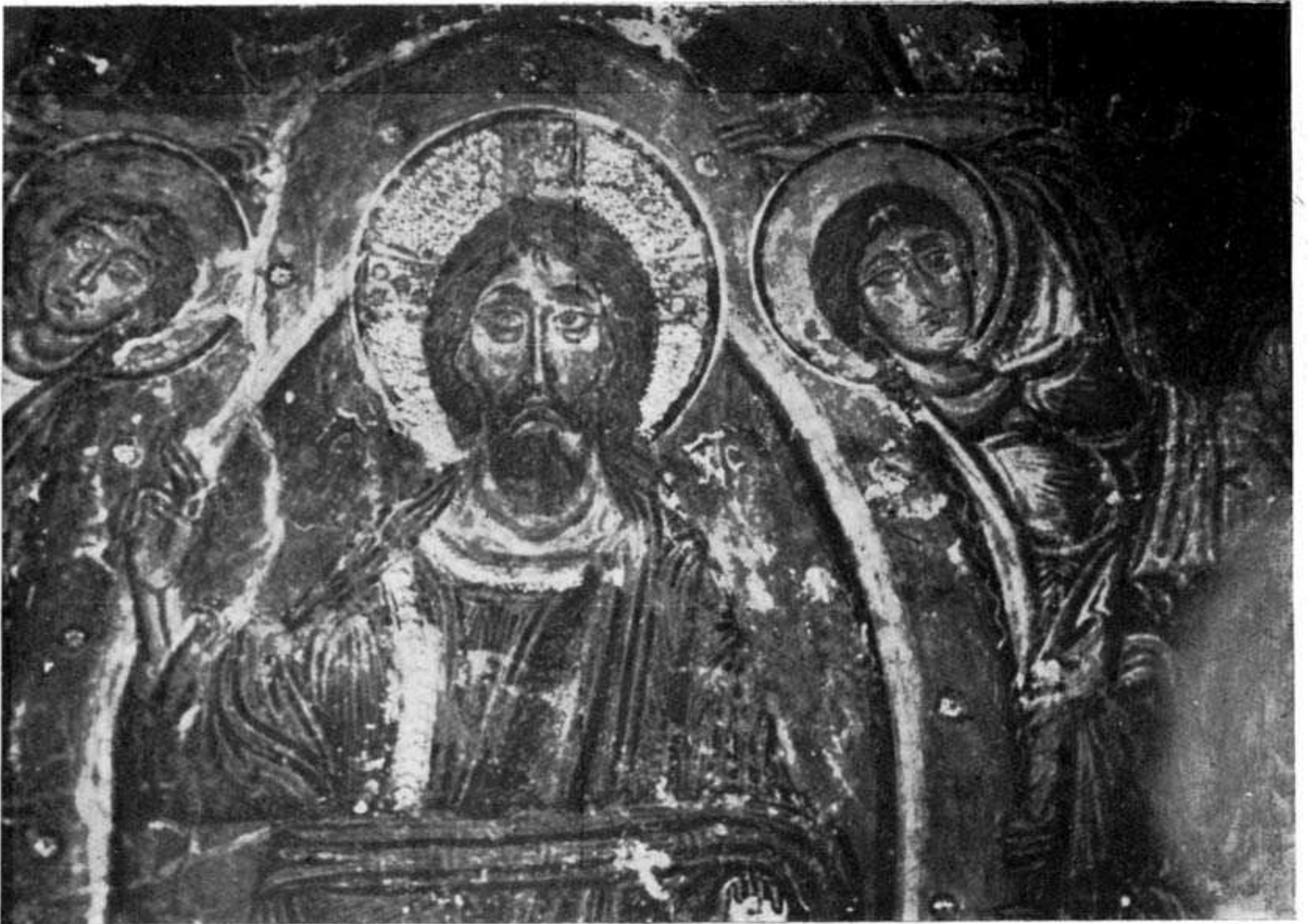
Εικ. 1 (άνω).—L'Ascension. Extrémité de la voûte à l'est de l'église «Κοίμησις» (Dormition de la Vierge) du village Thrónos (Rethymnon).— XIII - XIV siècle.