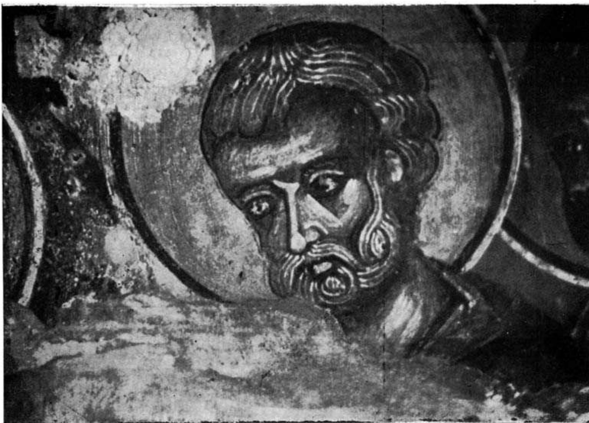
Εικ. 2. — S. Pierre. Détail de la scène «Dormition de la Vierge» à Thrónos. — XV siècle.