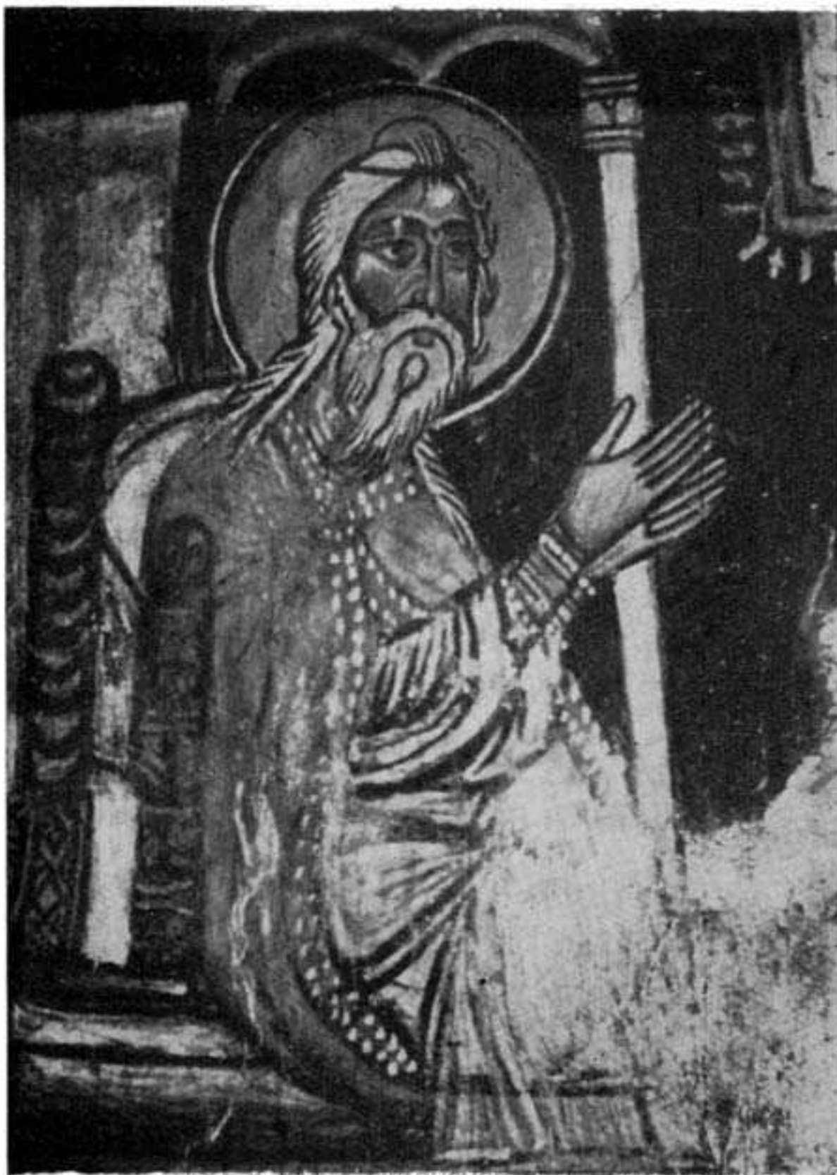
Εικ. 2 (άριστερά).—S Zacharie. Détail de la scène «Offrandes acceptées» à la même église à Thrónos. XIII - XIV siècle.