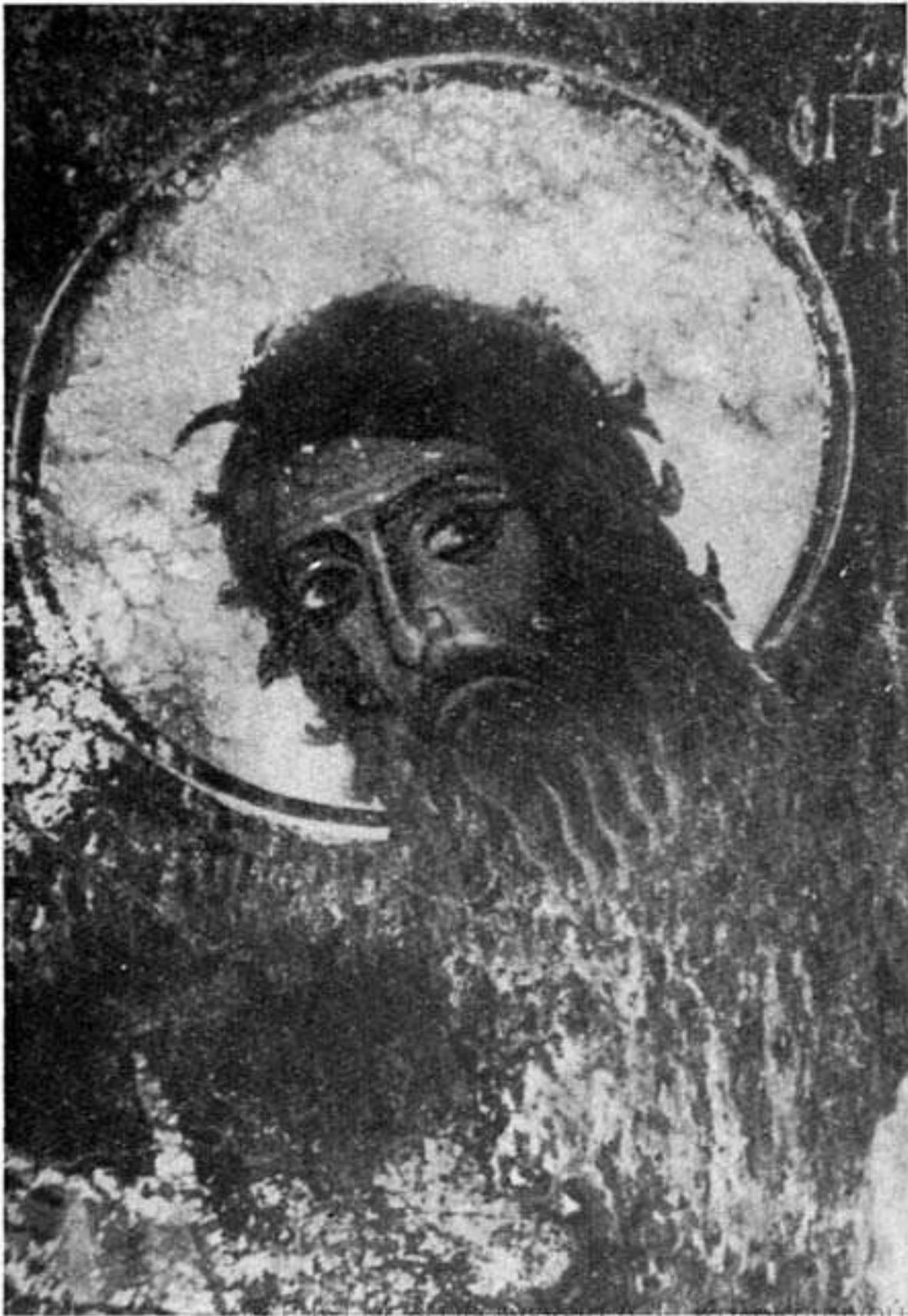
Εἰκ. 2 (ἄρριστερά).—S Jean Bapti- ste. Église S. Georges entre des villa- ges N. Amari et Meronas. - XIV siècle