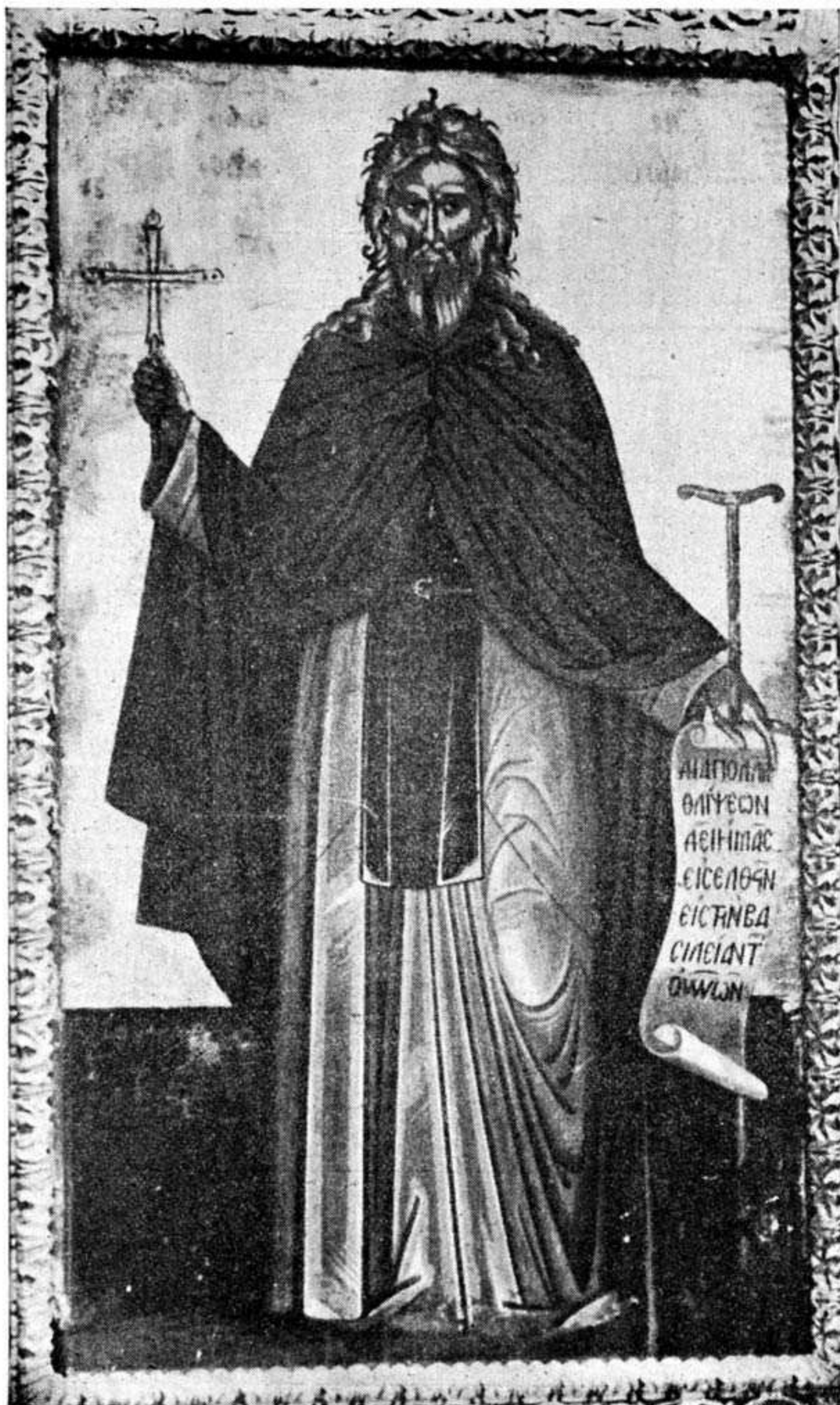
"Αγ. Ἰωάννης ὁ Ἐρημίτης (Μο. σ.ἰον Λοβέζδο ).