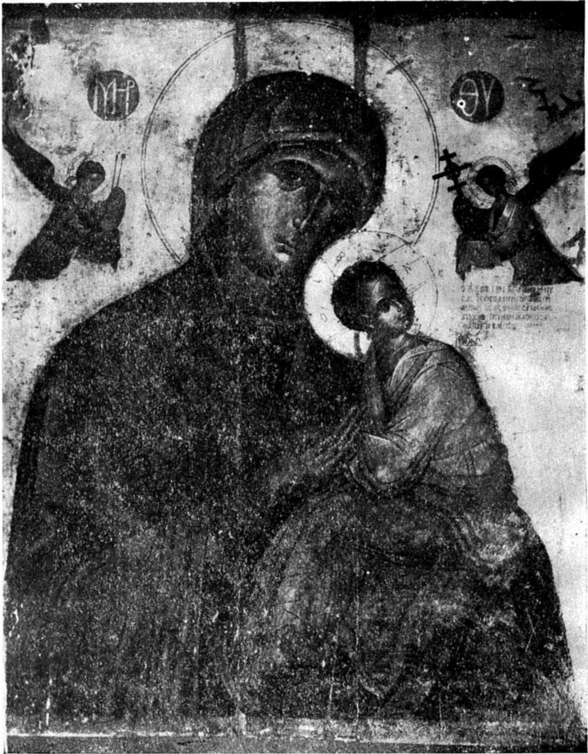
Ἡ Ρεθυμνία εἰκὼν τῆς Παναγίας τοῦ Πάθους