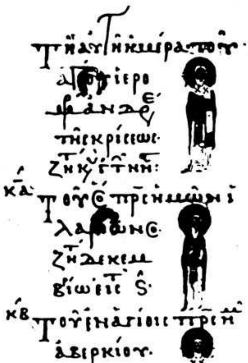
Εἰκὼν 1.— Κῶδιξ Vaticanus Graecus 1156, σελὶς 262 verso.

προσπάθειο, μετὰ τὴν ἀπελευθέρωσιν, ὥστε νὰ ἀποκατασταθῇ καὶ πάλιν ἡ ὀρθοδοξία 70 . Ἐτονίσθη ἤδη ἀνωτέρω ὅτι ἡ ἔξαρσις τῶν ἐκ Κρήτης ἀγίων ἐν Κωνσταντινουπόλει ἀπέβλεπε πρὸς αὐτὸν τὸν σκοπὸν, ὅπως ἐπίσης καὶ ἡ τιμὴ ἢ ἀποδομένη εἰς τὰ ἐν Κωνσταντινουπόλει λείψανά των. Πρὸς τὸν ἴδιον σκοπὸν εἶναι συνδεδεμένον βεβαίως καὶ περιστατικὸν, τὸ ὁποῖον μολονότι εἶναι τυπικὸν αὐτὸ καθ' ἑαυτό, ἀποκτᾷ, νομίζω, ἰδιαιτέραν σημασίαν λόγῳ τῶν εἰδικῶν συνθηκῶν τῆς ἐκκλησίας τῆς Κρήτης κατὰ τὴν ἐποχὴν καθ' ἣν συνέβη. Ὁ Μιχαὴλ Ἀτταλειάτης διηγεῖται ὅτι κατὰ τὴν ἀπόβασίν του εἰς τὴν Κρήτην καὶ τὴν πολιορκίαν τοῦ Χάνδακος ὁ Νικηφόρος Φωκᾶς ἔδωσεν ἐντολὴν καὶ κατεσκευάσθη μεγαλοπρεπὴς ναὸς τῆς Θεοτόκου μετὰ πλήθους εἰκονογραφιῶν: « Ναὸς ἀπηρτίσθη διὰ τριῶν ἡμερῶν περικαλλῆς καὶ σεβάσμιος, σφαιροειδῆ τὸν ὄροφον ἔχων καὶ παραπτέροις κεκοσμημένος καὶ κίοσι καὶ προνάοις καὶ κόσμῳ διηνηθισμένος μαρμάρων καὶ μορφαῖς ἀγίων περιαστραπτῶν καὶ ὅλως ἀπηρτισμένος εἰς