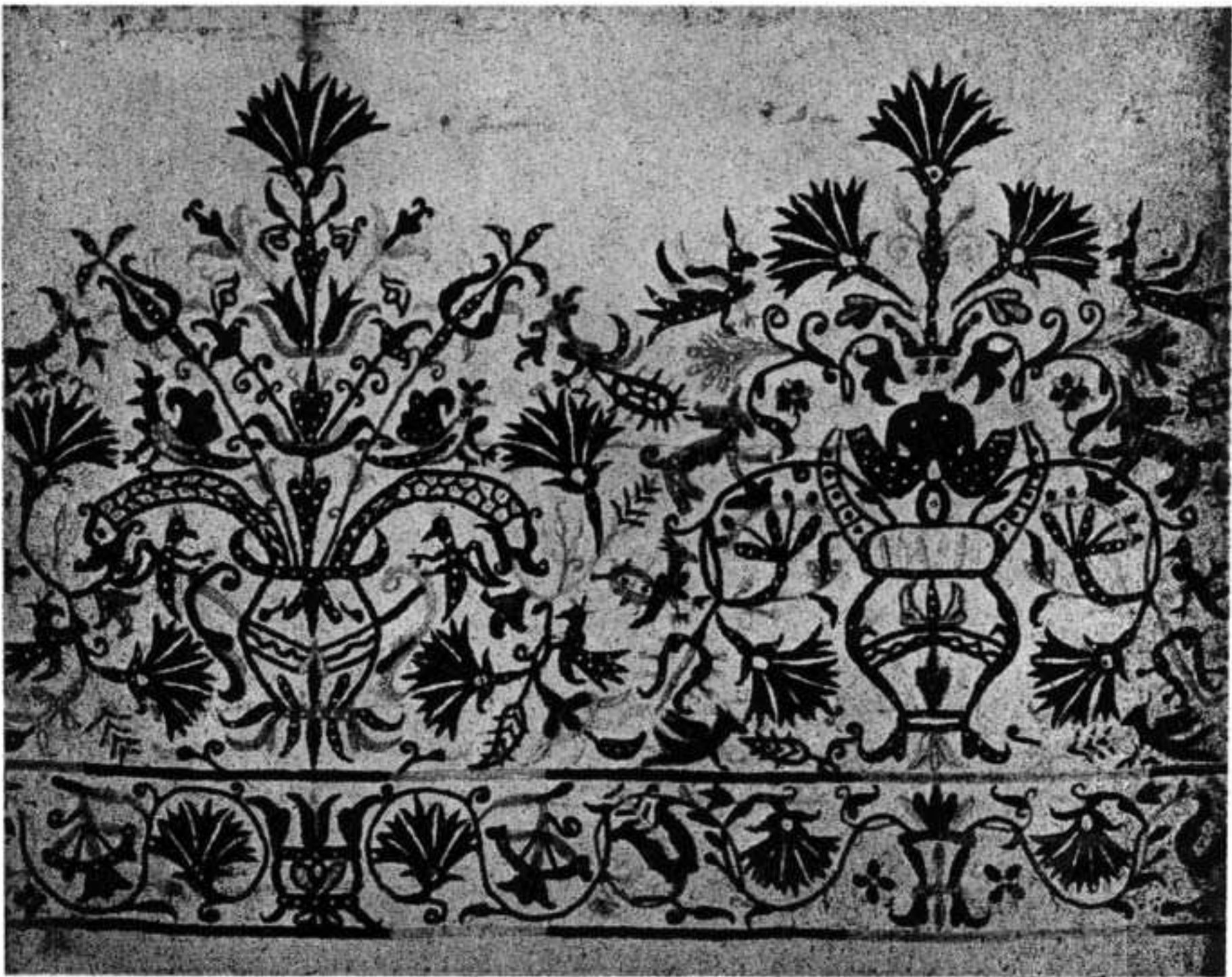
Κρητικά κεντήματα (Τ. Μ. 81, 50) της αὐτῆς Συλλογῆς.