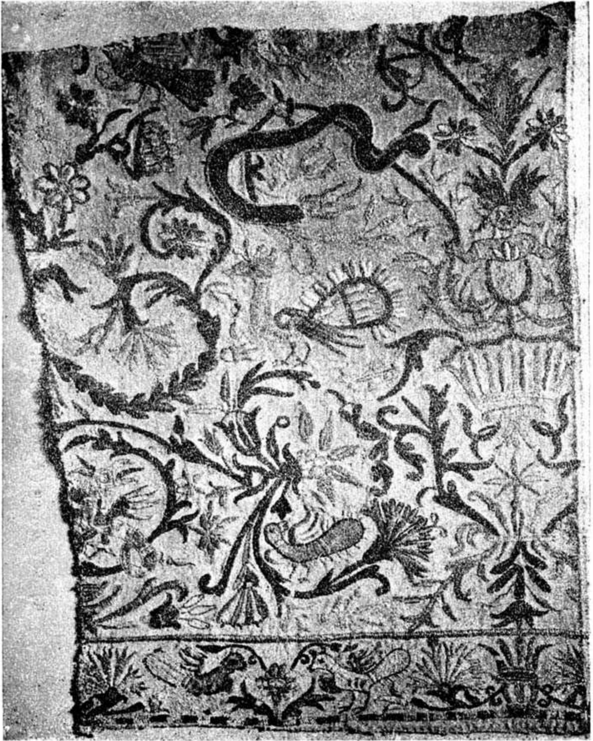
Κρητικόν ζέντημα (T. M. 81, 69) τῆς αἰτῆς Συλλογῆς.