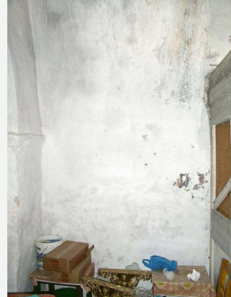
ΝΟΤΙΟΣ ΤΟΙΧΟΣ ΙΕΡΟΥ