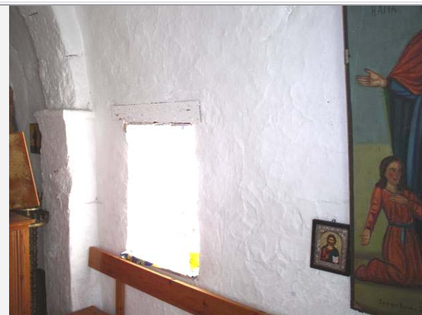
ΠΕΡΙΟΧΗ ΚΥΡΙΩΣ ΝΑΟΥ