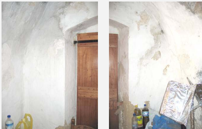
ΑΠΟΨΗ ΑΠΟ ΤΟΝ ΔΥΤΙΚΟ ΤΟΙΧΟ