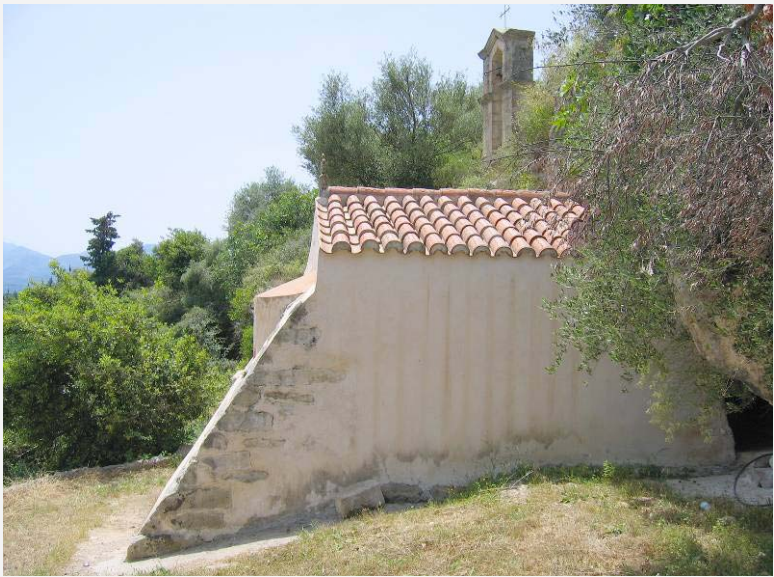
ΝΟΤΙΑ ΟΨΗ ΤΟΥ ΝΑΟΥ