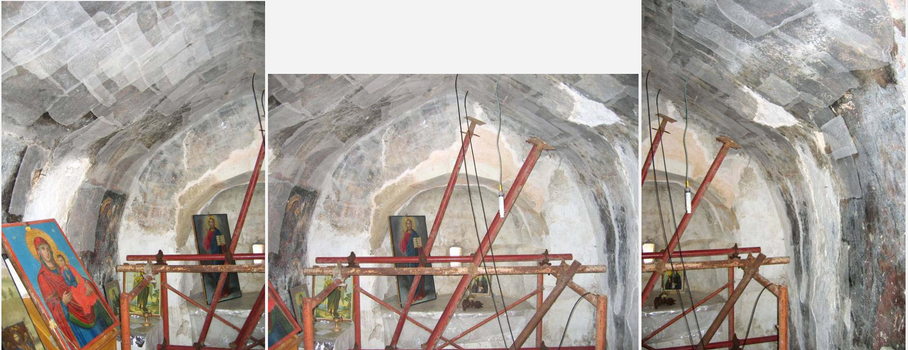
ΒΟΡΕΙΟΣ ΚΑΙ ΝΟΤΙΟΣ ΤΟΙΧΟΣ, ΘΡΙΑΜΒΙΚΟ ΤΟΞΟ ΚΑΙ ΤΕΤΑΡΤΟΣΦΑΙΡΙΟ