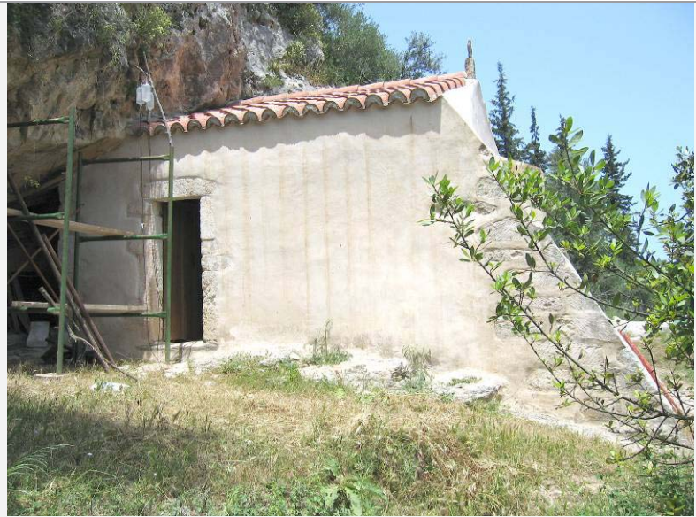
ΒΟΡΕΙΑ ΟΨΗ ΤΟΥ ΝΑΟΥ