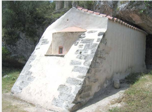
ΝΟΤΙΟΑΝΑΤΟΛΙΚΗ ΟΨΗ ΤΟΥ ΝΑΟΥ