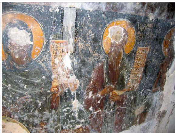
ΛΕΠΤΟΜΕΡΕΙΑ ΑΠΟ ΤΟΝ ΒΟΡΕΙΟ ΤΟΙΧΟ