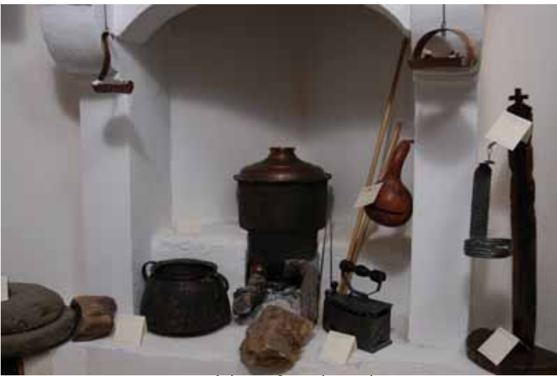
Παλιά Παραδοσιακά Αντικείμενα