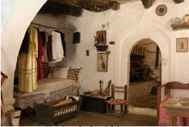
Αναπαράσταση Παραδοσιακής Οικίας