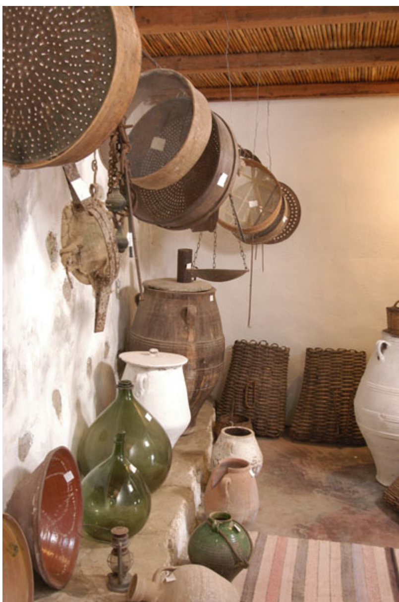
Αναπαράσταση παλαιάς αποθήκης