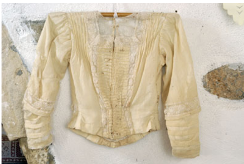
Μεσοφόρι Γυναικείας παραδοσιακής φορεσιάς

Παρατίθεται υλικό από το Λαογραφικό Μουσείο του Χανδρά. (Περισσότερο φωτ. υλικό στο φάκελο με τις φωτογραφίες)