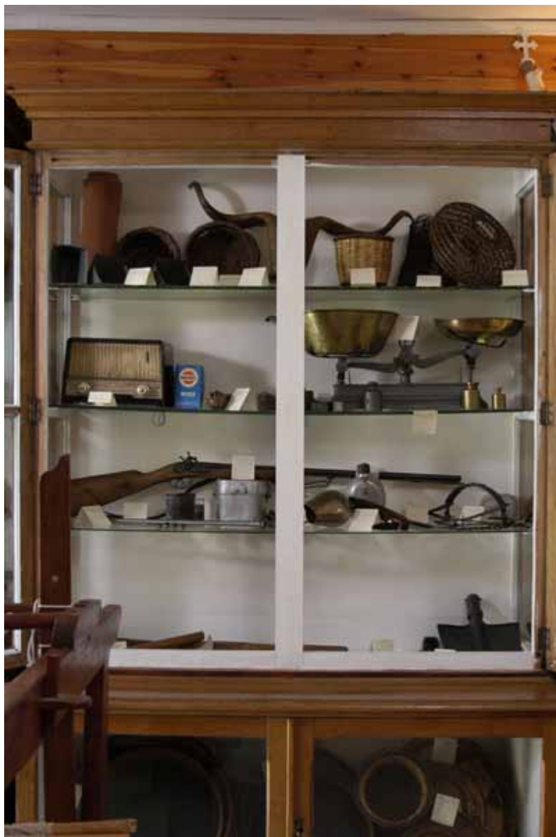
Παλιά Παραδοσιακά Αντικείμενα

Μερικά από τα στοιχεία που παρατίθενται στο Λαογραφικό Μουσείο Ίστρου εμφανίζονται παρακάτω.