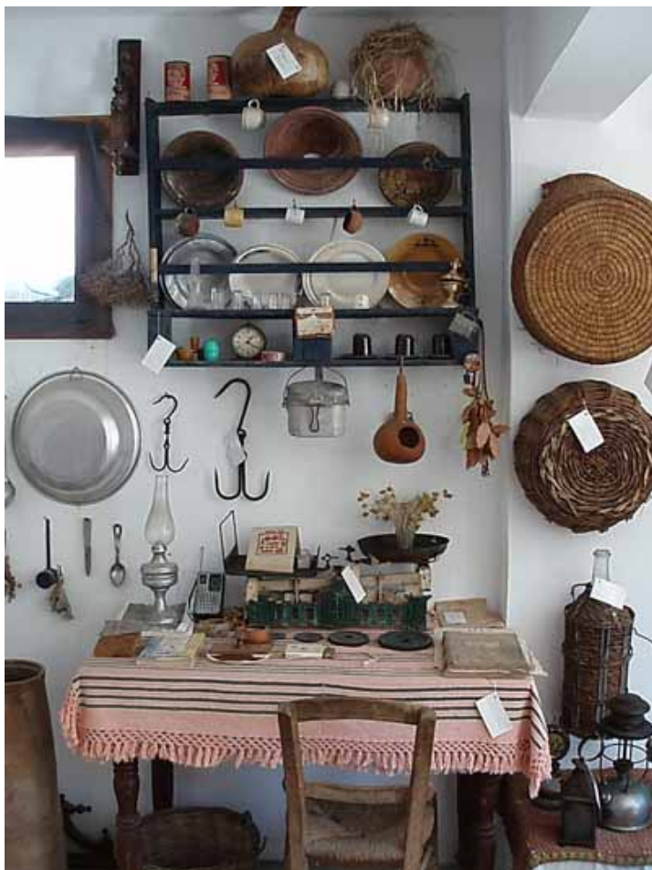
Παραδοσιακό τραπέζι με οικιακά είδη