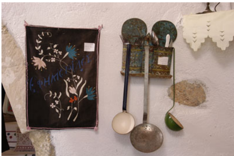
Παλαιά Παραδοσιακά αντικείμενα