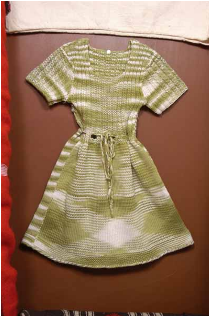
Μάλλινο παιδικό φουστανάκι