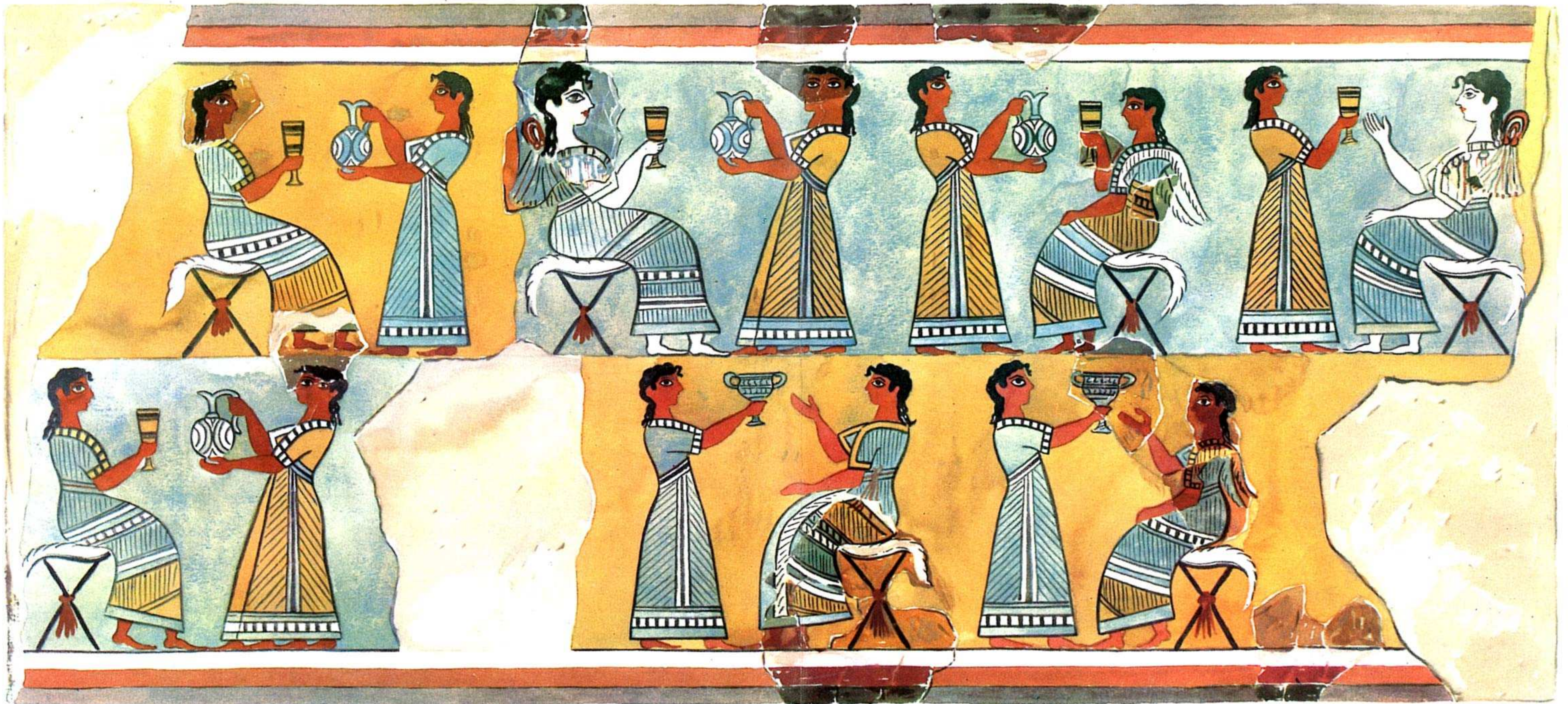
Η ΤΟΙΧΟΓΡΑΦΙΑ ΤΗΣ ΠΡΟΣΦΟΡΑΣ ΣΠΟΝΔΩΝ ΕΚ ΚΝΩΣΟΥ