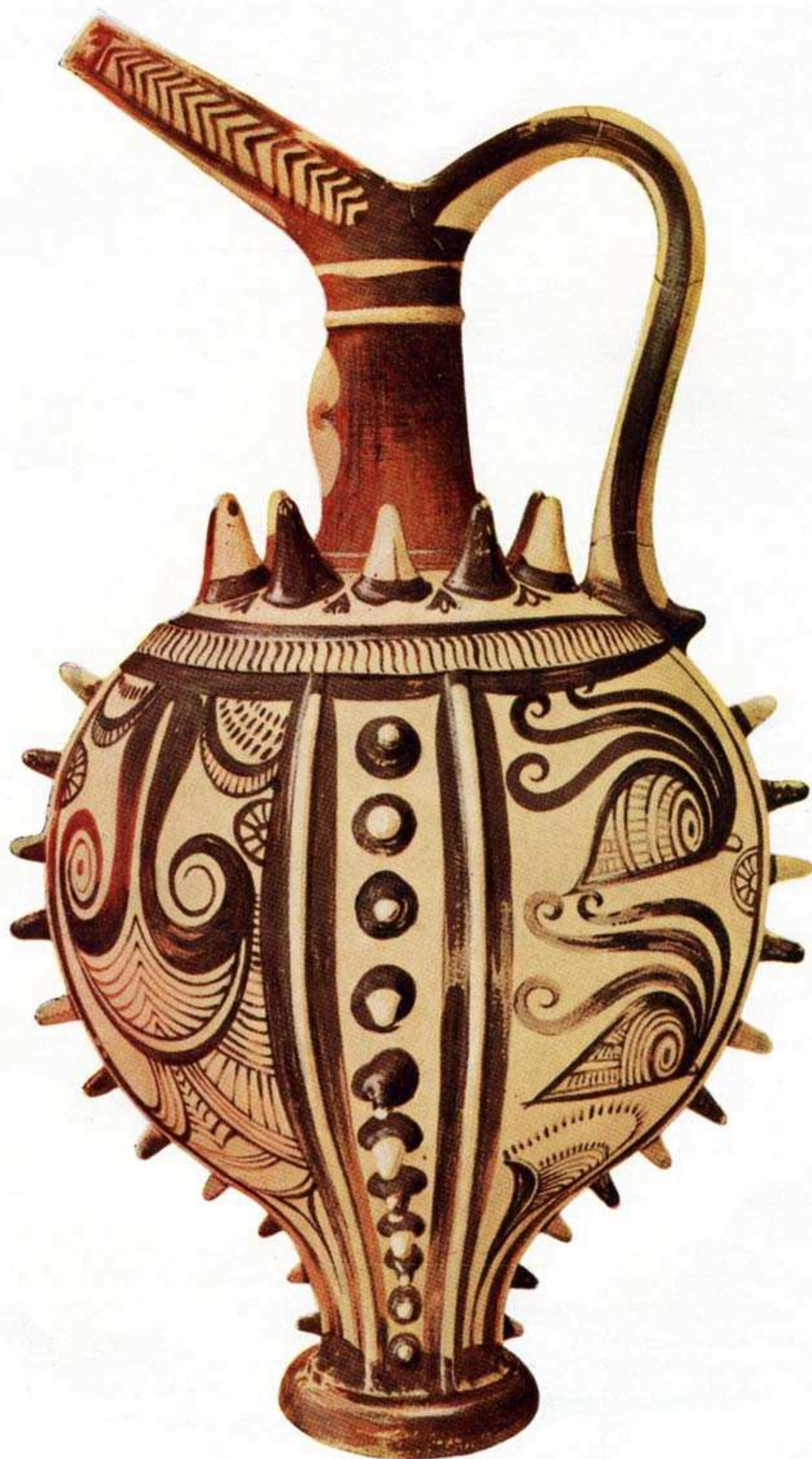
Ἀνάγλυφος πρόχους μινωικοῦ τάφου Κατσαμπᾶ Ἡρακλείου