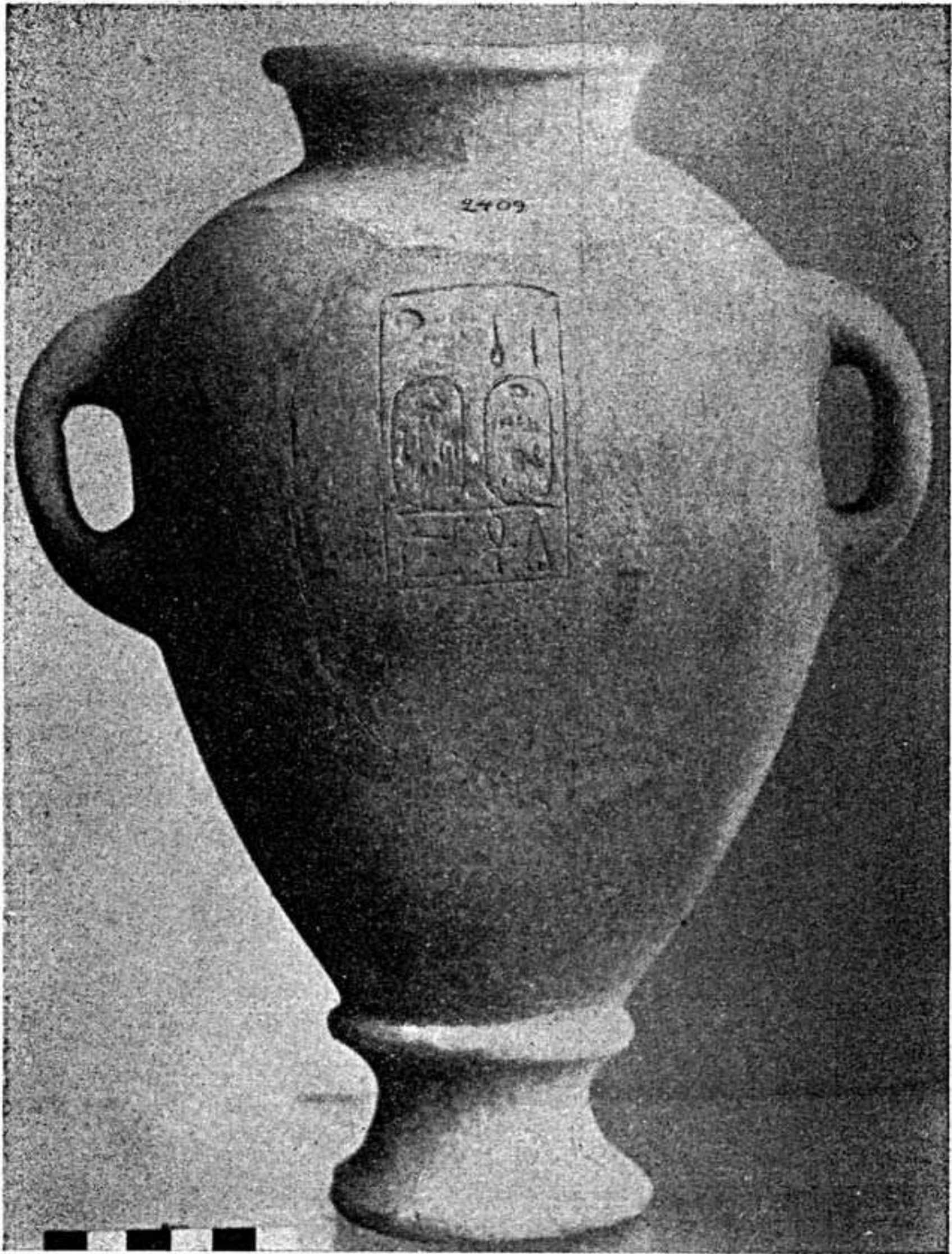
Εἰκ. 1.—Ὁ ἐνεπίγραφος ἀλαβάστρινος ἀμφορεύς.

στη δυνατόν νὰ περισυλλεγῆ λόγω τῆς τελείας ἀποσυνθέσεως τοῦ ξύλου, ἀλλ' ἐσώζετο σχεδὸν ἀκεραία κατὰ τὴν ἀνακάλυψιν, ἐμελετήθη δὲ