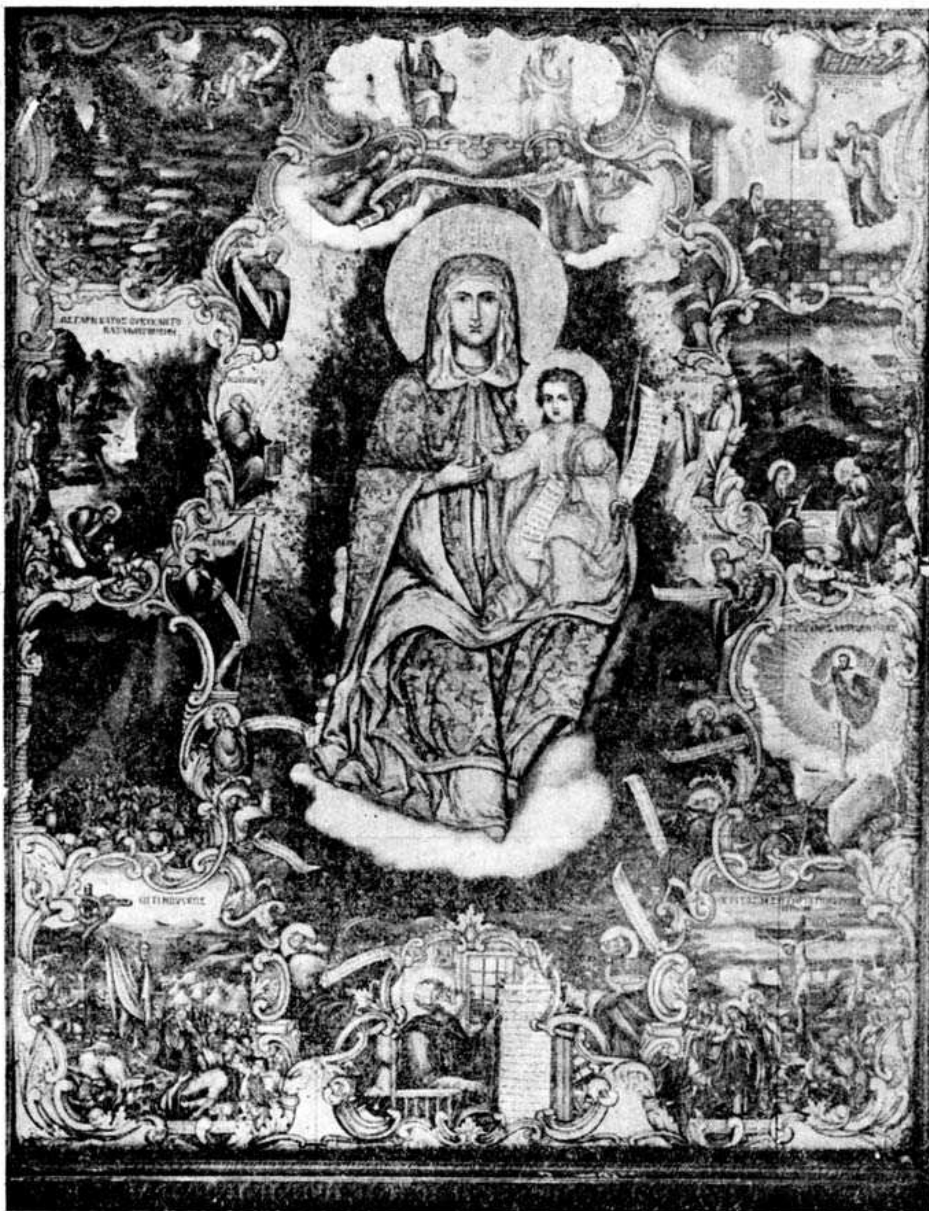
Στεφάνου Νικολαΐδου: «Παρήλθεν ἡ σκιά τοῦ νόμου», Ἅγιος Τίτος, Ἡράκλειον.