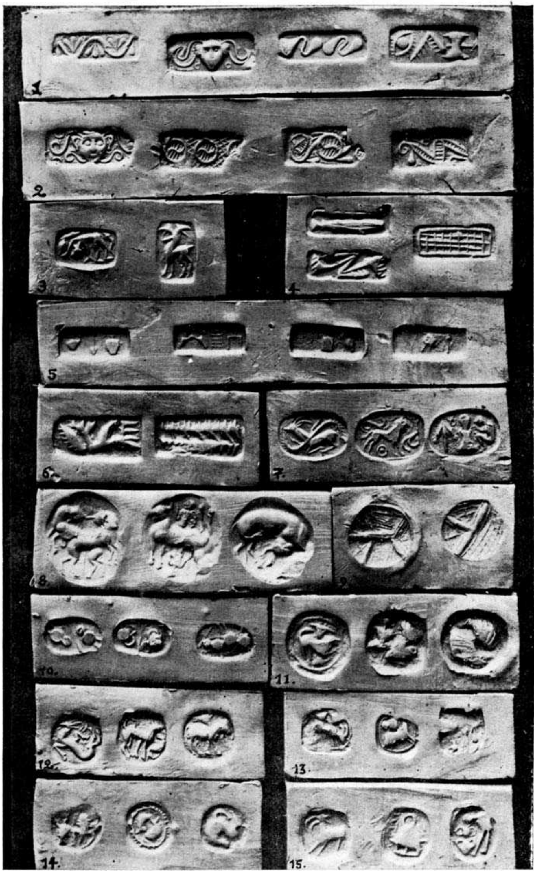
Προσηματιστοὶ μινωικοὶ σφραγιδολίθοι τῆς συλλογῆς Γιαμαλάκη