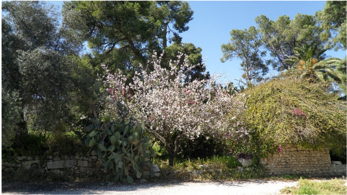
Εικόνα 17: Κατά μήκος του δυτικού ορίου του κήπου υπάρχει επίμηκες «περιβόλι» με οπωροφόρα δέντρα εκατέρωθεν αναχώματος με αιωνόβια πεύκα (Μάρτ. 2011)