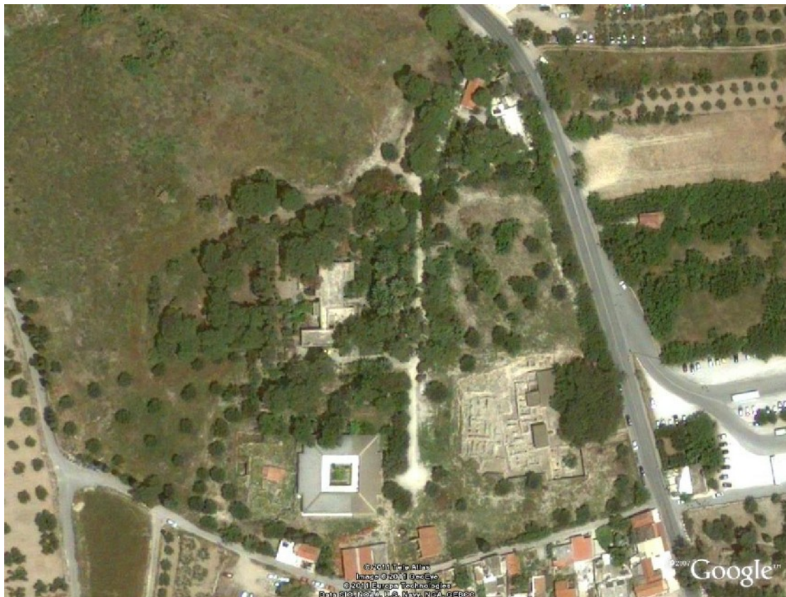
Εικόνα 2: Γενική άποψη του ιστορικού κήπου της βίλας «Αριάδνη»