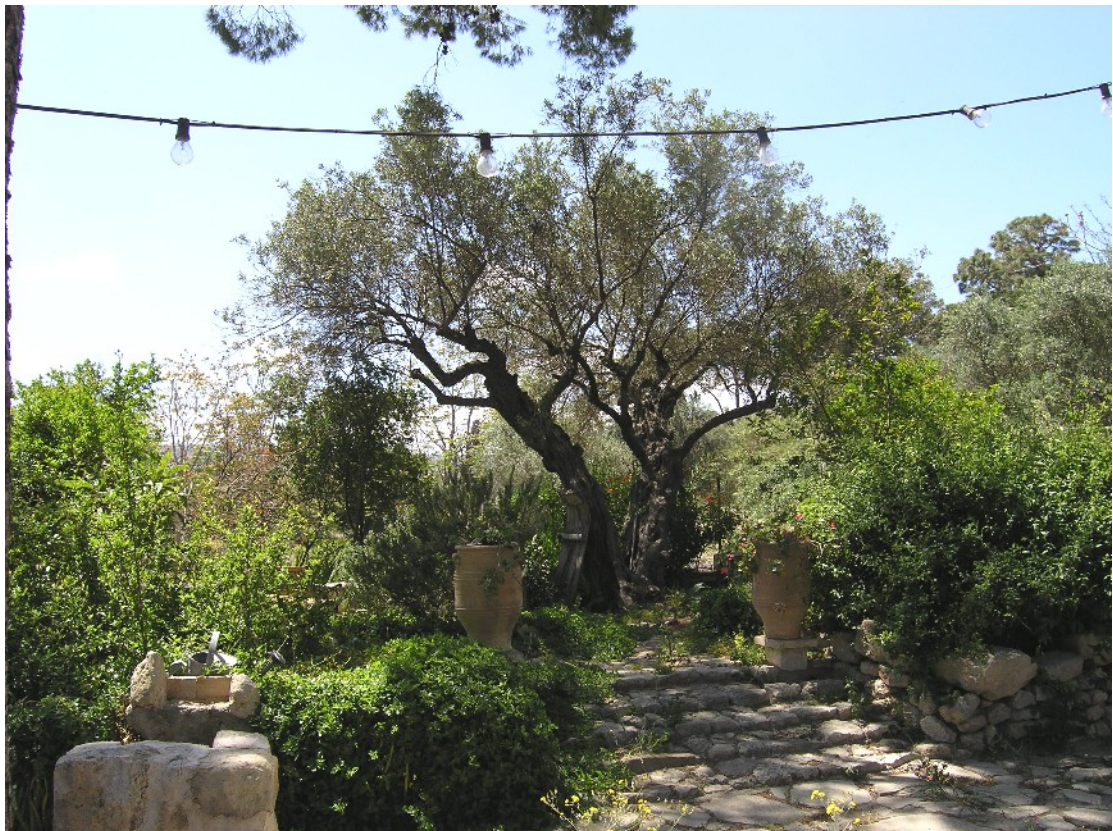
Εικόνα 24: Φυτοτεχνική διαμόρφωση στον κήπο της Βρετανικής Σχολής, με κυρίαρχο στοιχείο την ελιά (Απρ. 2009)