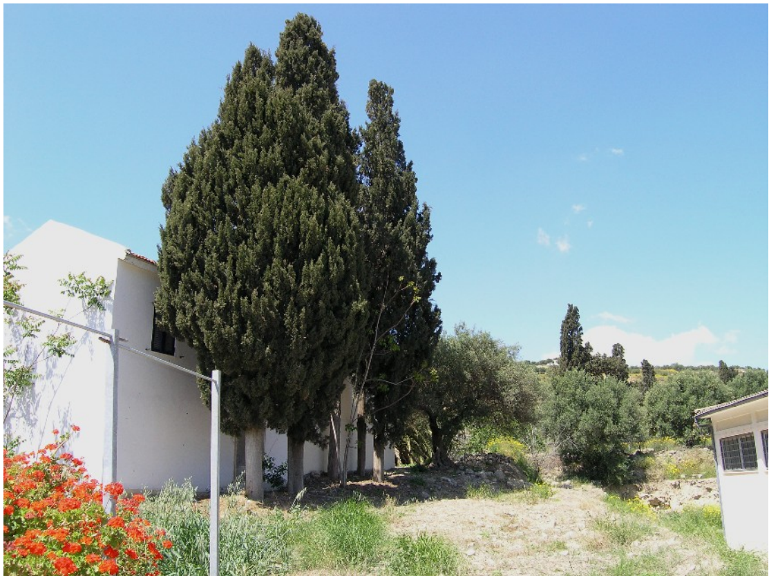
Εικόνα 18: Τμήμα της σειράς των ορθόκλαδων κυπαρισσιών στο νοτιοδυτικό όριο της έκτασης της βίλας «Αριάδνη», προς τον οικισμό (Απρ. 2009)