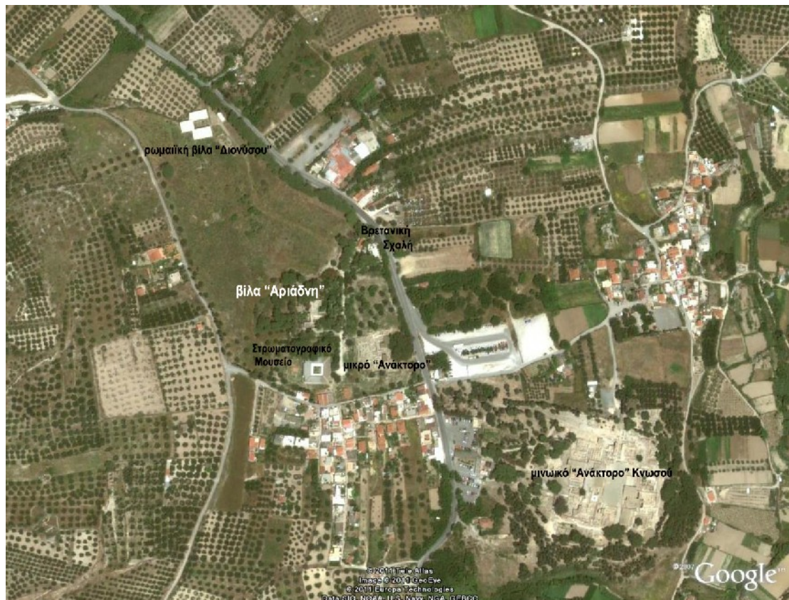
Εικόνα 1: Γενική άποψη της περιοχής της βίλας «Αριάδνη» Κνωσού