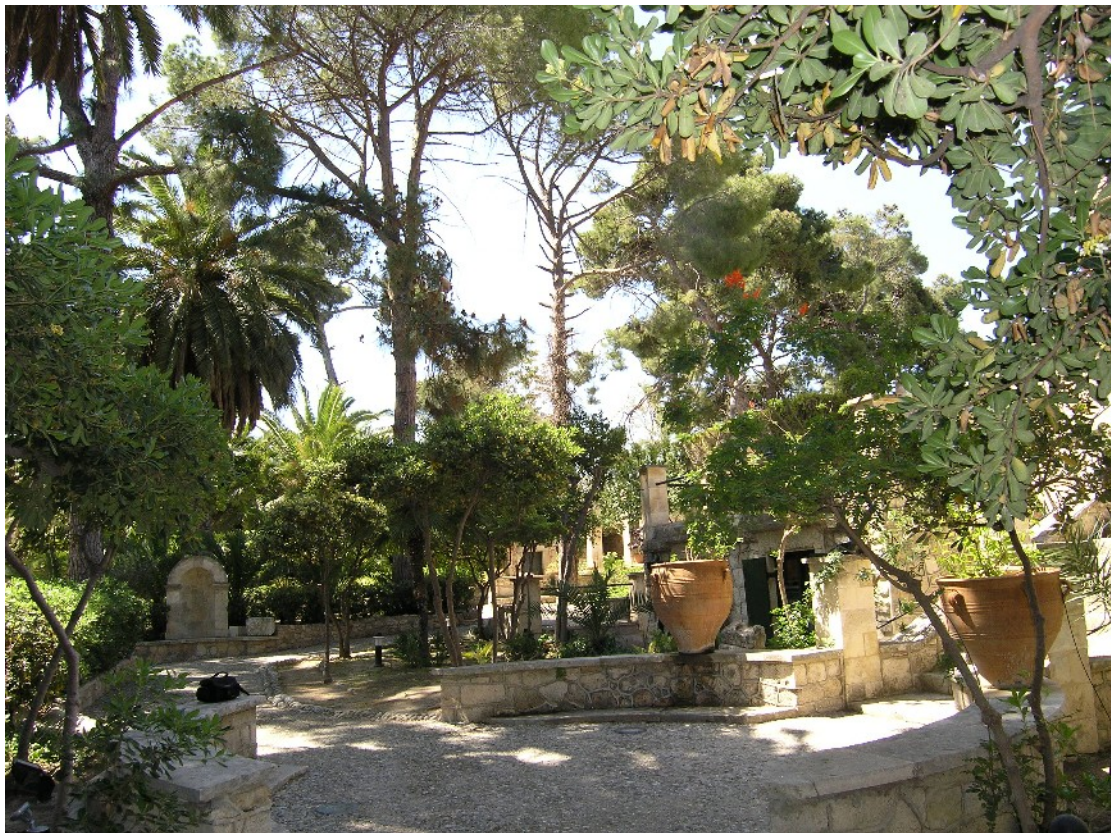
Εικόνα 22: Το τμήμα του κήπου μπροστά από την είσοδο της βίλας. Ο χώρος αποτελεί ένα ήσυχο και καταπράσινο περιβάλλον στο περιαστικό αρχαιολογικό τοπίο της Κνωσού (Απρ. 2009)