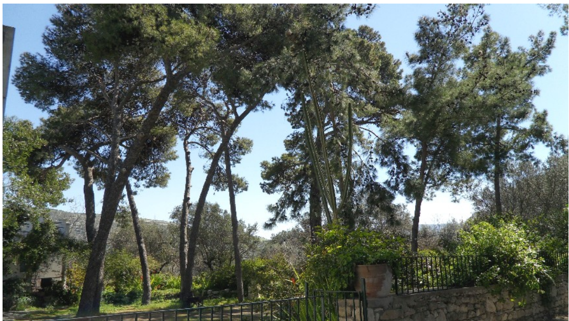
Εικόνα 16: Η συστάδα της τραχείας πεύκης στον περιβάλλοντα χώρο των οικημάτων της Βρετανικής Αρχαιολογικής Σχολής (Μάρτ. 2011)