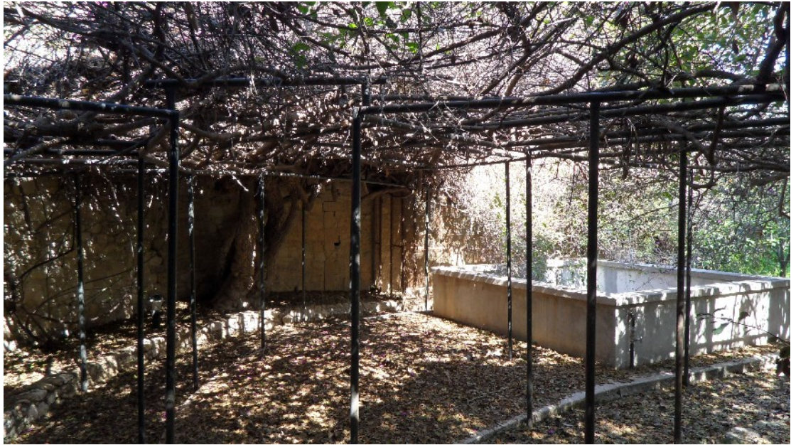
Εικόνα 11: Ο χώρος της πισίνας-δεξαμενής με τις μπουκαμβίλιες ( Bougainvillea glabra ) να αναρριχώνται στην πέργκολα της ανατολικής πλευράς του κήπου (Μάρτ. 2011)