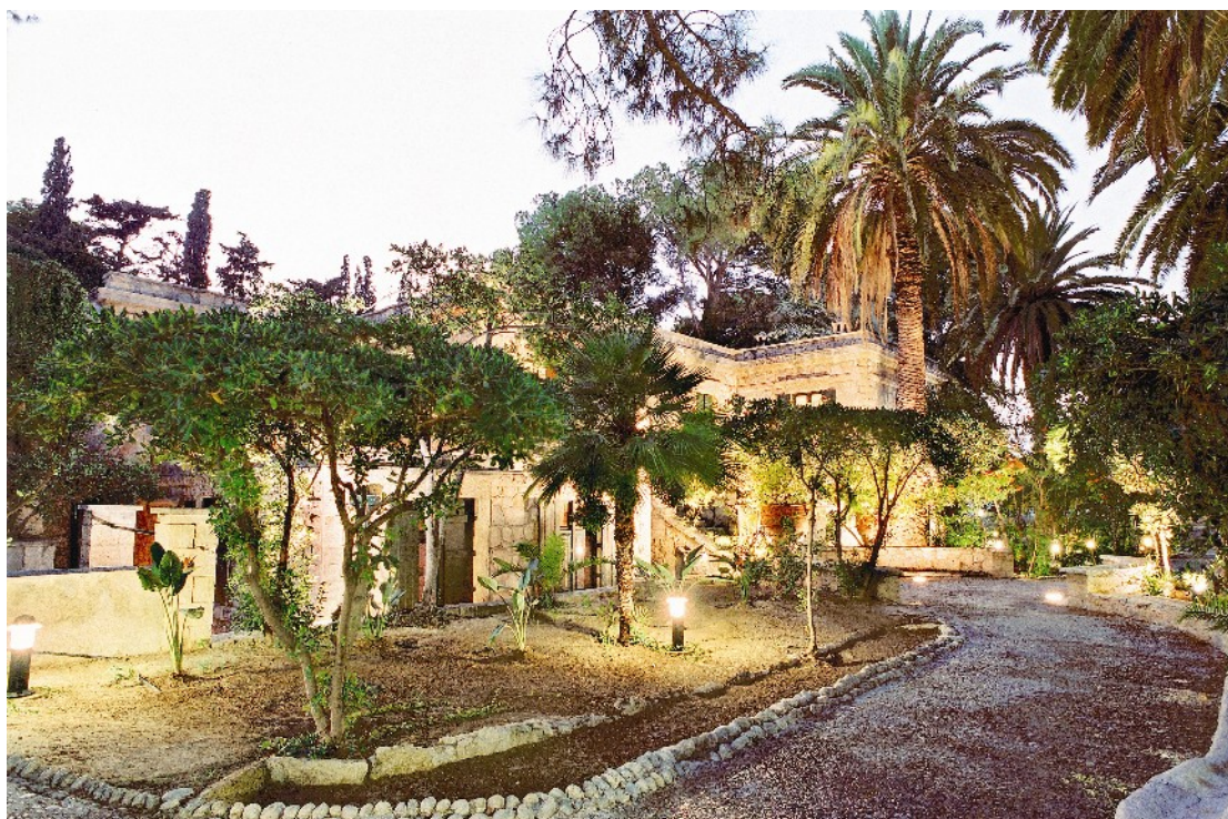
Εικόνα 19: Στα πλαίσια της αποκατάστασης της βίλας «Αριάδνη» (2000-2002), οι διάδρομοι στρώθηκαν με βότσαλα και ο κήπος απέκτησε ηλεκτροφωτισμό (φωτογραφία αρχείου)