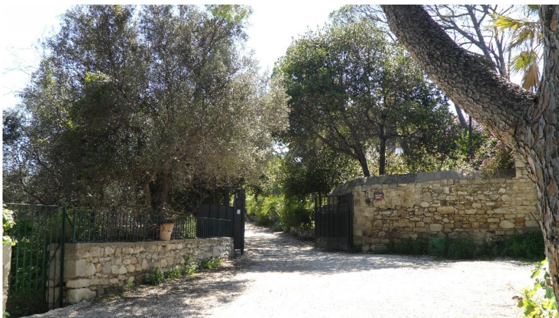
Εικόνα 25: Η είσοδος του ιστορικού κήπου της βίλας «Αριάδνη», καθώς και η περίμετρος του, δεν διαθέτουν σήμερα ηλεκτροφωτισμό (Μάρτ. 2011)