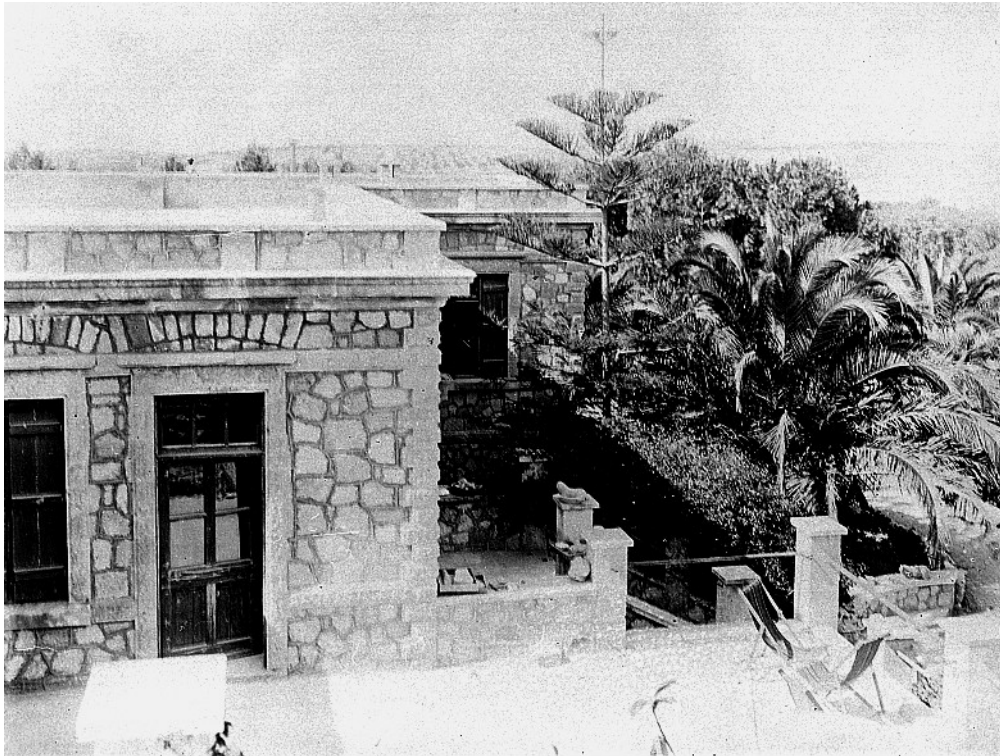
Εικόνα 7: Η δυτική βεράντα της βίλας «Αριάδνη», τόπος συνάθροισης και ανάπαυσης κατά τους χρόνους των ανασκαφών της Κνωσού (ιστορικό αρχείο)