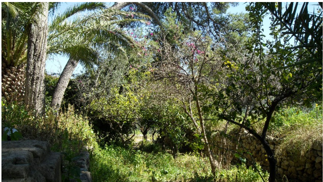
Εικόνα 12: Το «περιβόλι» με τα οπωροφόρα δέντρα στο δυτικό τμήμα της βίλας παρουσιάζει την εικόνα της έλλειψης καλλιεργητικής φροντίδας (Μάρτ. 2011)