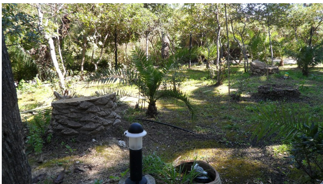
Εικόνες 13 & 14: Μέχρι την άνοιξη του 2011 έχουν κοπεί πέντε κανάριοι φοίνικες που προσβλήθηκαν από το κολεόπτερο Rhynchophorus ferrugineous (Μάρτ. 2011)