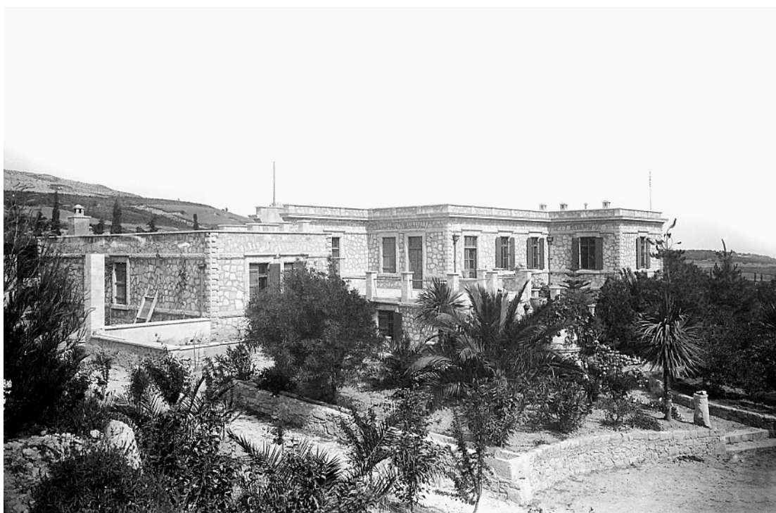
Εικόνες 3, 4 & 5: Η βίλα «Αριάδνη» και η διαμόρφωση του κήπου στις αρχές του προηγούμενου αιώνα (ιστορικό αρχείο)