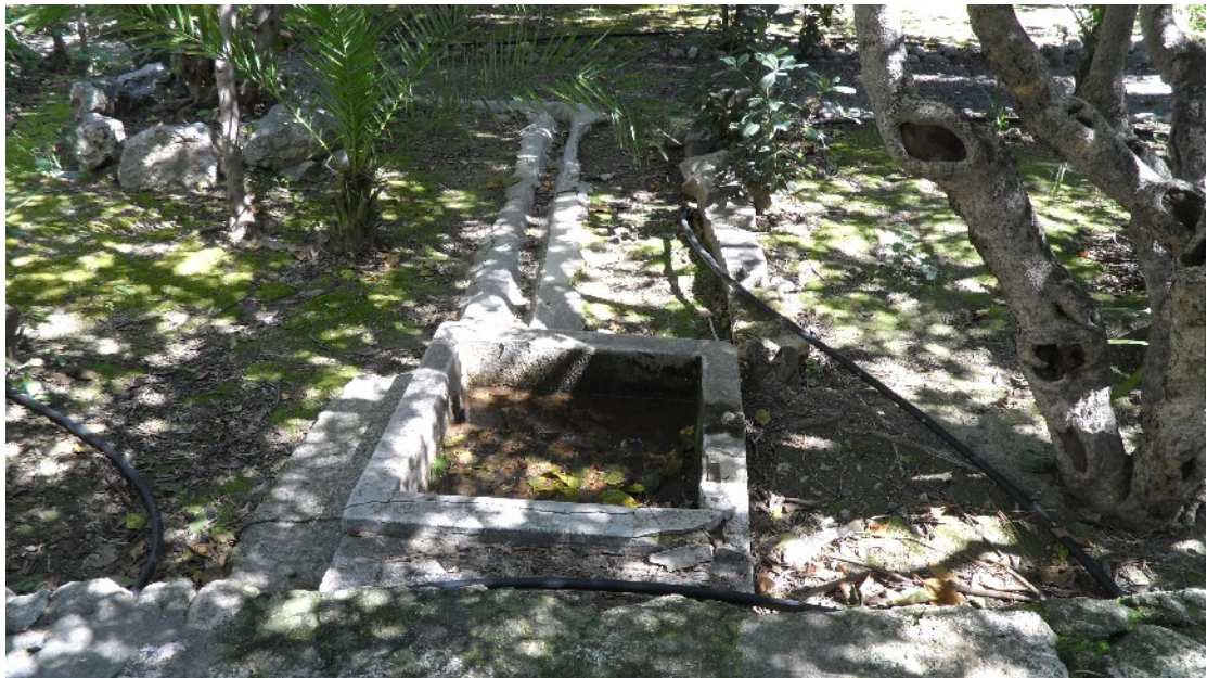
Εικόνα 10: Τα όμβρια του κήπου συγκεντρώνονταν και μέσα από ένα σύστημα μικρών καναλιών άρδευαν τα φυτά στα παρτέρια (Μάρτ. 2011)