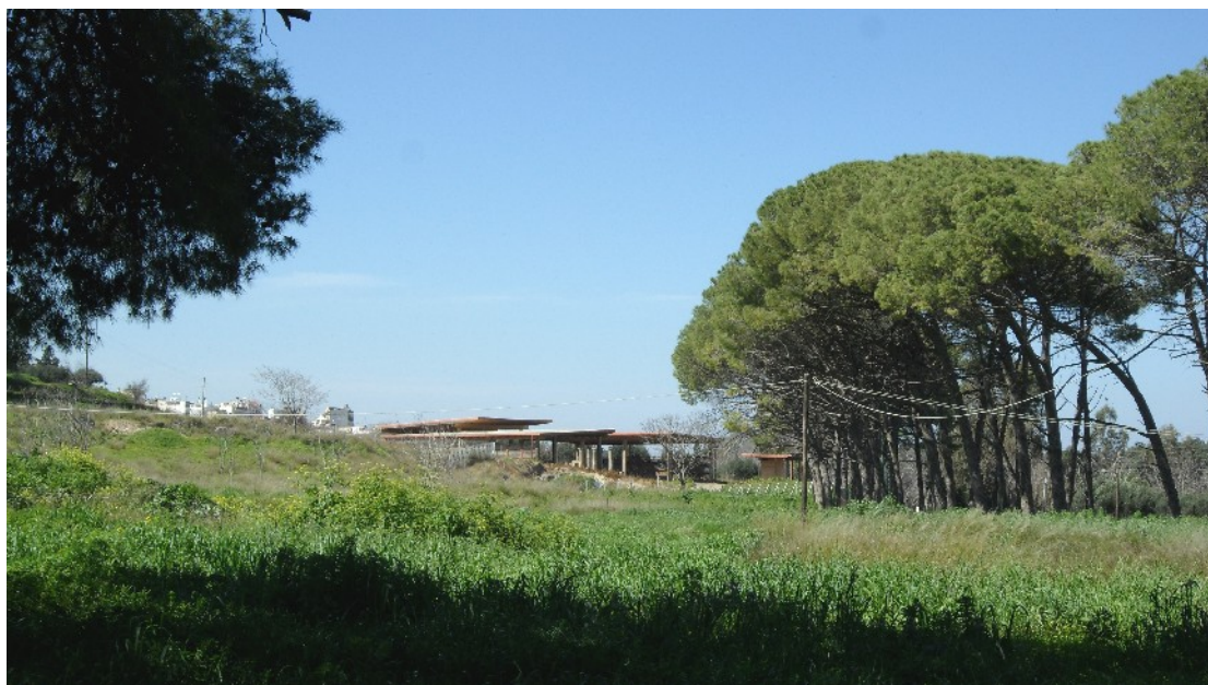
Εικόνα 20: Ξύλινα στέγαστρα προστατεύουν τις ανασκαφές στο χώρο της ρωμαϊκής βίλας «Διονύσου» (Μάρτ. 2011)