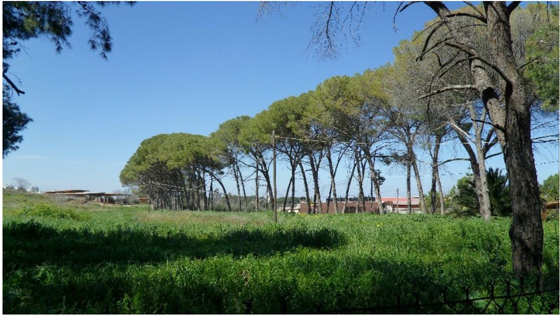
Εικόνα 15: Η δεντροστοιχία των πεύκων Pinus brutia , κατά μήκος της επαρχιακής οδού, δεσπόζει στο ανατολικό όριο της έκτασης της βίλας «Διονύσου» (Μάρτ. 2011)