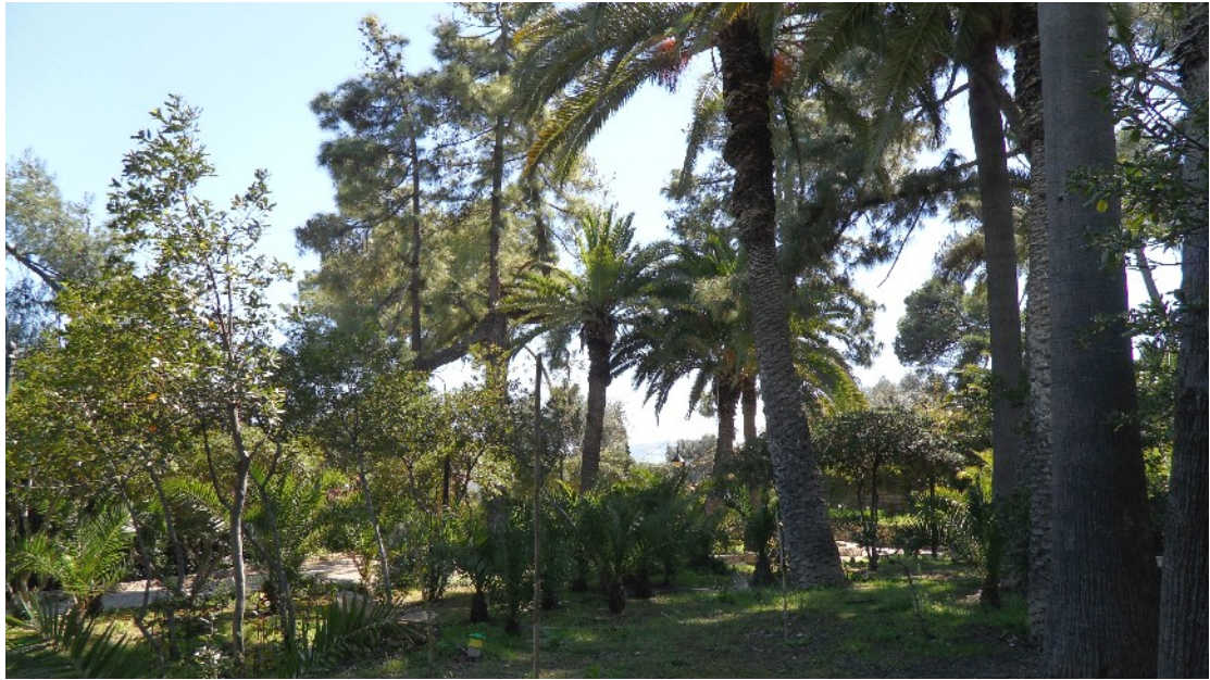
Εικόνα 9: Η βλάστηση κυρίως των πεύκων ( Pinus canariensis ) και των φοινίκων ( Phoenix canariensis - Washingtonia filifera ) στην είσοδο, νότιο τμήμα της βίλας (Μάρτ. 2011)