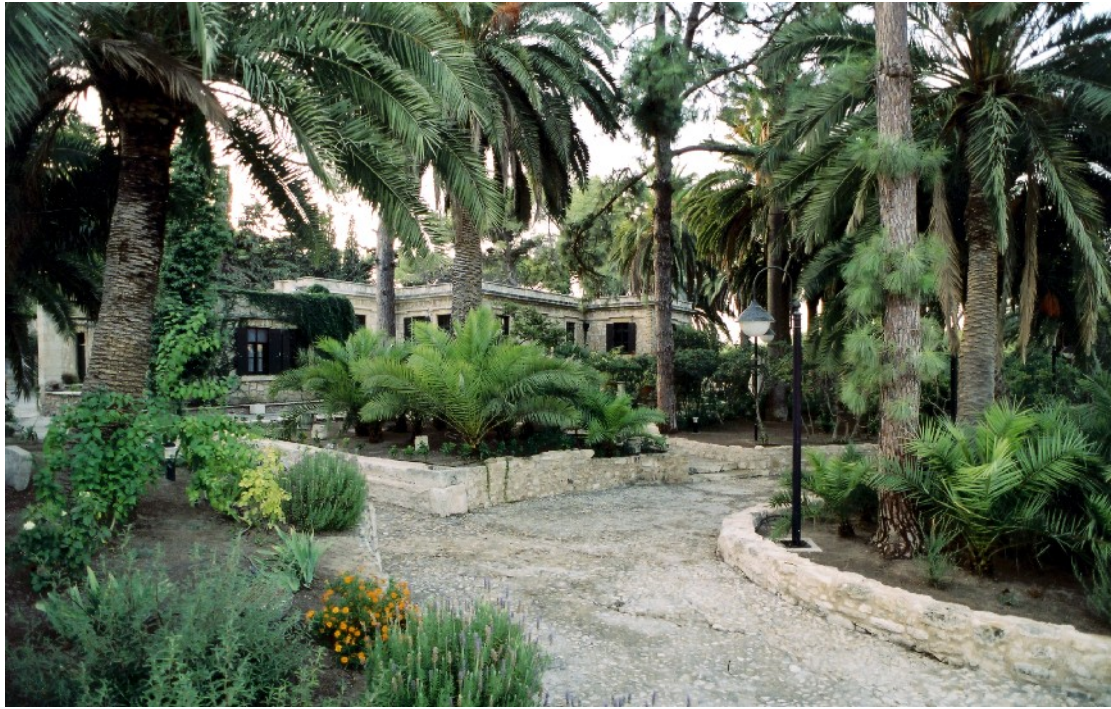
Εικόνα 21: Άποψη των διαμορφώσεων του ιστορικού κήπου της βίλας «Αριάδνη» στο μπροστινό (νότιο) τμήμα, όπου εμφανίζεται η λιτότητα των τεχνικών κατασκευών και ο πλούτος της βλάστησης (φωτογραφία αρχείου)