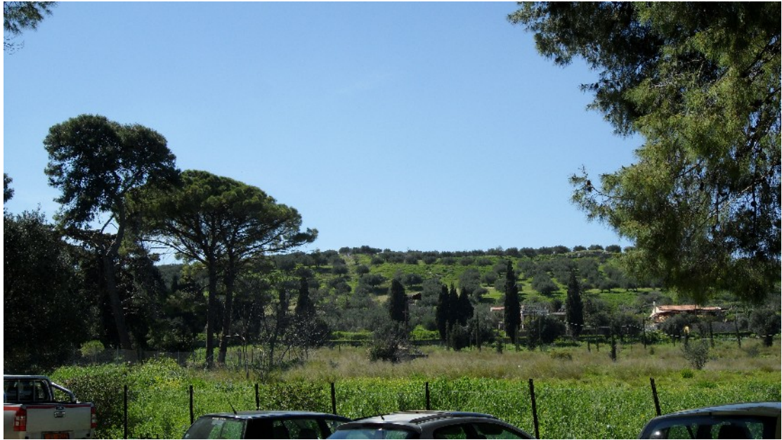
Εικόνα 23: Η βλάστηση πεύκων ( Pinus brutia ) και κυπαρισσιών ( Cupressus sempervirens var. pyramidalis ) στο νοτιοδυτικό όριο της έκτασης της βίλας «Διονύσου» (Μάρτ. 2011)